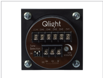
电源与音源接线板(背面)