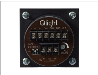
电源与音源接线板(背面)