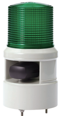
S100DL / S100DS