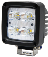
QWL40 / QWL40-DT